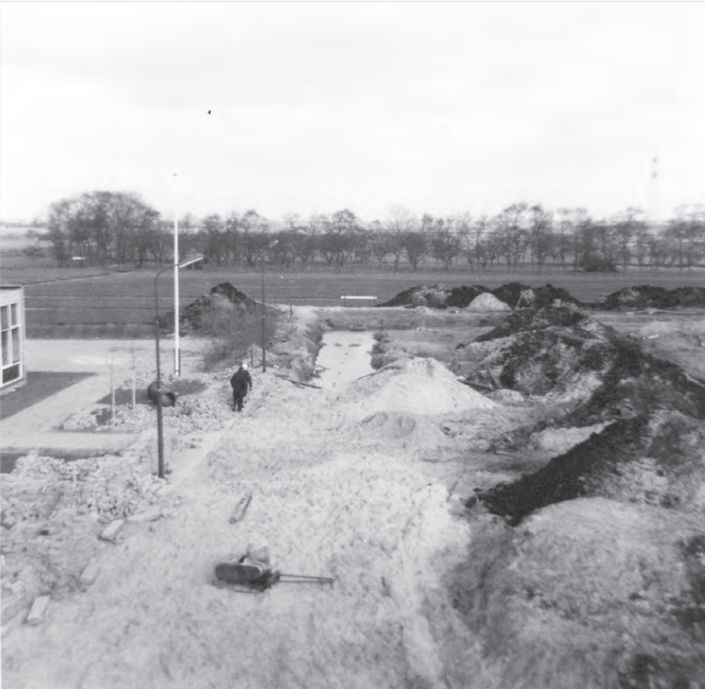
11 DE NIEUWBOUWACTIVITEITEN KREGEN BEGIN JAREN ZEVENTIG EINDELIJK GESTALTE. DE SCHOOL LINKS (HET HUIDIGE TREPPUNT) IS HIER KLAAR, MAAR VERDER IS HET NOG EEN WOESTENIJ (1971).

In het kader van de gemeentelijke herindeling wordt het dorp per 1 januari 1993 uiteindelijk toch onderdeel van een andere gemeente, namelijk Graft-de Rijp. Juist nu staat de bevolking niet te trappelen voor een overstap want het contact met Uitgeest is beter dan ooit en daarbij vindt Graft-de Rijp de Contactcommissie een overbodige instelling. Echter, men gunt toch de nieuwe moedergemeente het voordeel van de twijfel en na ongeveer 400 jaar wordt de officiële band met Uitgeest verbroken!