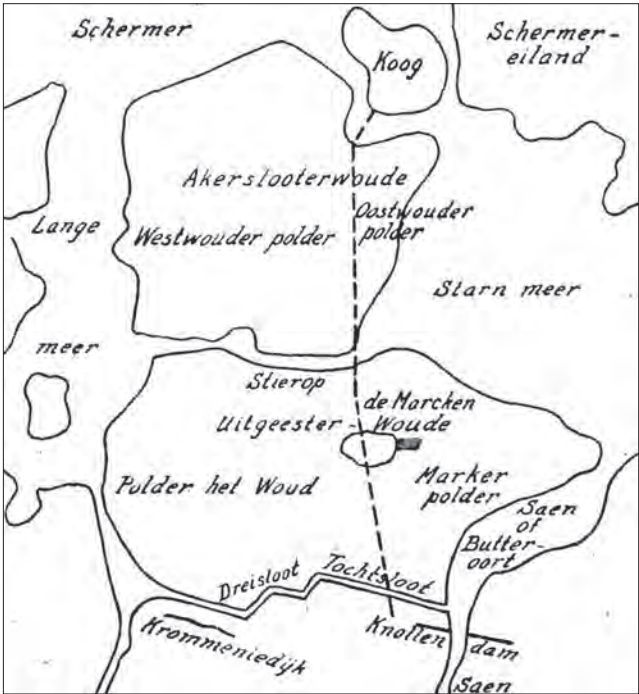
2 DE SITUATIE IN 1400. HET GEARCEERDE TEN OOSTEN VAN HET MARKERMEERTJE DUIDT DE PLAATS VAN DE BURCHT AAN. DE STIPPELIJN LAAT ZIEN WAAR NU DE MARKERVAART LOOPT.