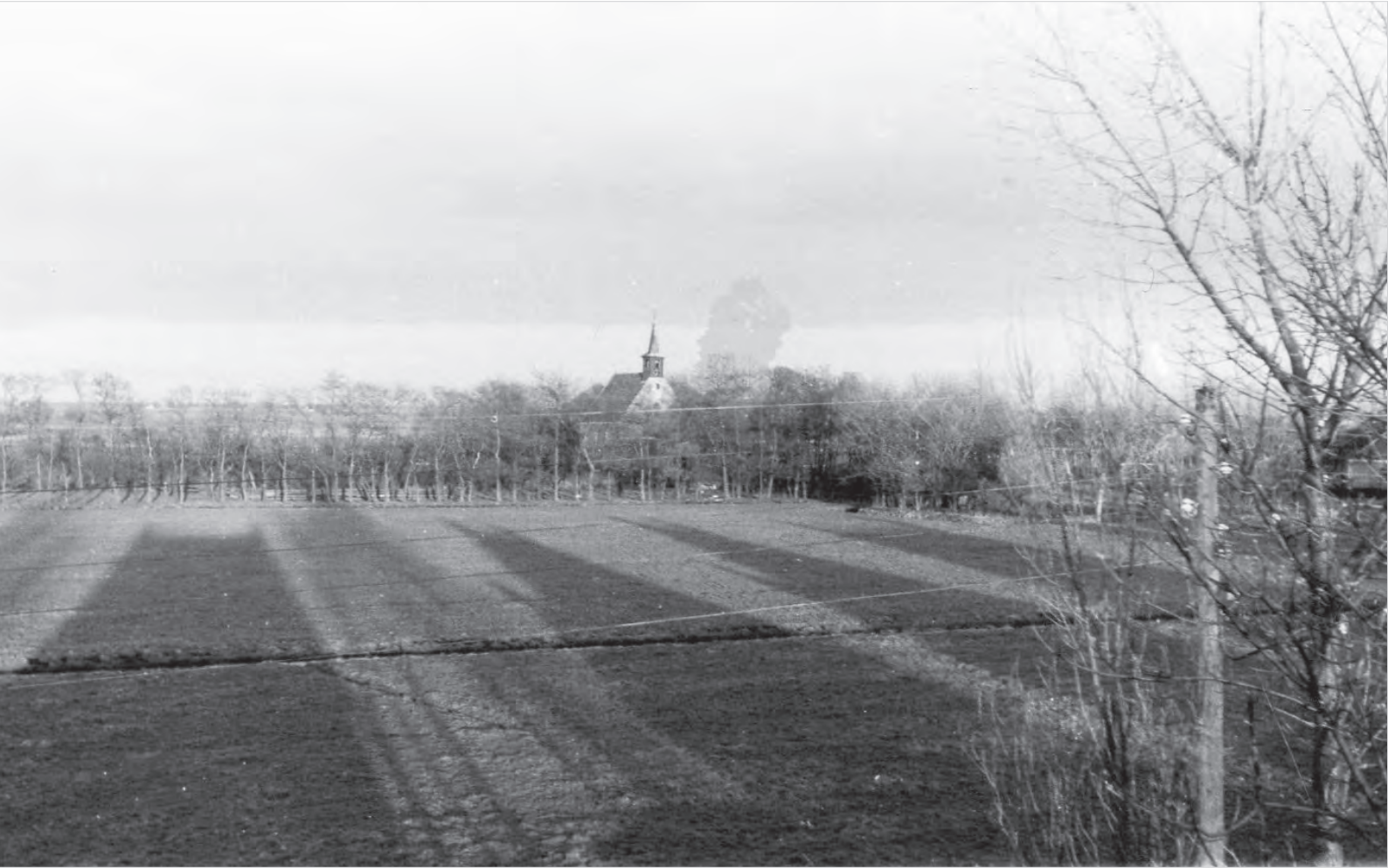
12 HET WEILAND BIJ DE INANG VAN HET DORP VÓÓR DE BOUWACTIVITEITEN. DE STROOMVOORZIENING GING TOEN NOG BOVENGRONDS (1968).