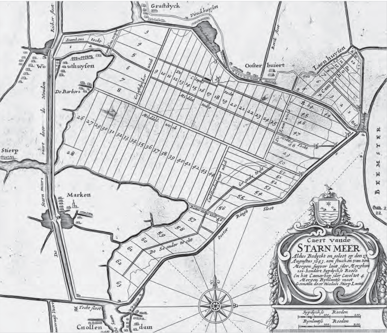
7 DE KAART VAN DE PAS VERKAVELDE STARNMEERPOLDER (1643). RECHTSBOVEN ZIJN DE VIER MOLENS INGETEKEND DIE DE POLDER DROOG MAALDEN. MARKENBINNEN HEETTE TOEN NOG 'MARCKEN'.

Ruim daarvoor werden achtereenvolgens de Beemster (1612), de Purmer (1623), de Wormer (1626) en de Schermer (1635) drooggemalen. Met name bij de Beemster was dit profijtelijk geweest want door de goede koolzaadopbrengsten was men al met één jaar uit de kosten! Het Alkmaardermeer (of Langemeer) bleef echter als waterplas behouden omdat de zanderige bodem ongeschikt was voor landbouw. De centrale persoon bij de droogmakingen was molenaarszoon Jan Adriaanszn. Leeghwater uit de Rijk. Deze maakte de berekeningen en hield ook het toezicht bij de uitvoering. Door deze ingrepen werd de oppervlakte van het boezemwater (de berging van het uitgemalde polderwater) echter sterk verkleind. Daarom waren in samenhang met de droogmaking van de Schermer al de Markervaart (1632) en de Nauernasche vaart gegraven om het overtollige water sneller naar het IJ bij Nauerna te kunnen loodszen. Maar deze maatregelen waren nog niet voldoende want het 'oude land', waaronder ook de Markerpolder, kwam